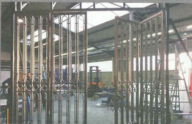
Lenoir Métallerie se développe vers la serrurerie fine, ici pour Hermès